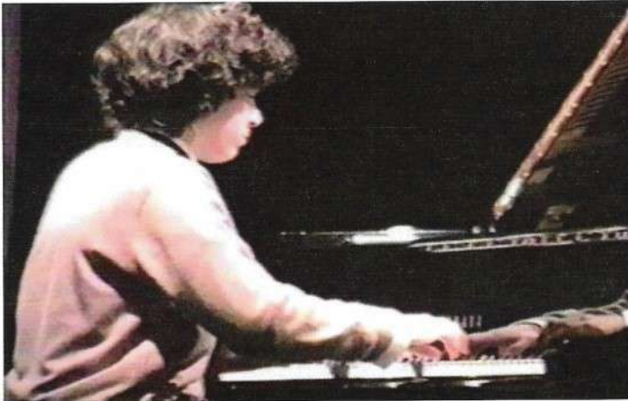
Premier concours de piano à l'âge de 8 ans

+ Voir à la fin de ce livre l'article de presse « Instruit à la maison ».