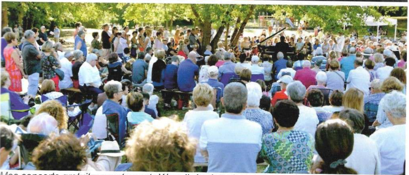
Mes concerts gratuits pour tous et délocalisés dans la nature