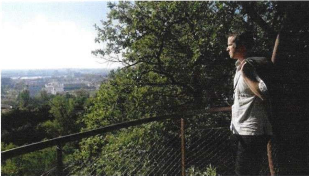
Ressourcement en solitaire dans la nature