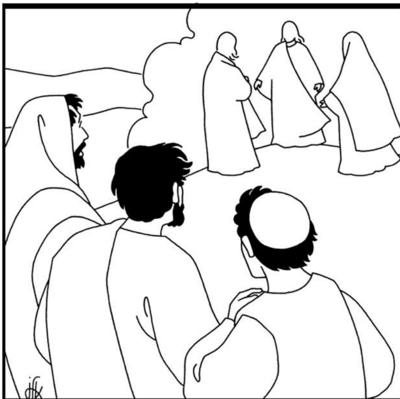
Les disciples voient Jésus parler à Moïse et Élie