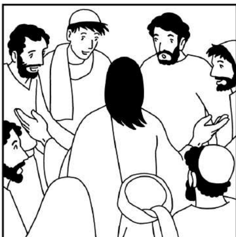
IMAGE À COLORIER

Jésus dit : « La paix soit avec vous ! » Les disciples étaient tout joyeux. Puis Jésus leur dit : « Le Père m'a envoyé. Moi aussi je vous envoie ». Alors Jésus souffle sur les disciples et dit : « Recevez le souffle saint. À ceux à qui vous remettrez les péchés, ils seront remis. »