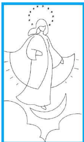
IMAGE À COLORIER

NOUS TE SALUONS, Ô TOI NOTRE DAME MARIE VIERGE SAINTE QUE DRAPE LE SOLEIL COURONNÉE D'ÉTOILES, LA LUNE EST SOUS TES PAS EN TOI NOUS EST DONNÉE L'AURORE DU SALUT