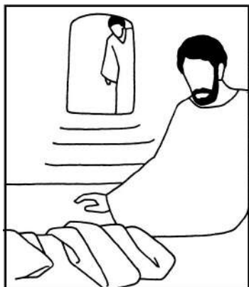
IMAGE À COLORIER

L'autre disciple voit, les mêmes choses que Marie Magdala et Simon-Pierre mais il croit. On ne sait ce qu'il croit. Il croit : il est dans la confiance, en paix. L'amour de Jésus qu'il garde en son cœur lui suffit.