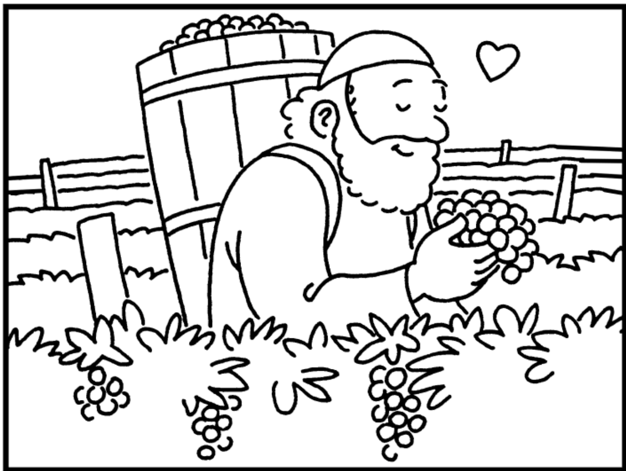
IMAGE A COLORIER

Avec l'histoire de ce maître, Jésus nous fait entendre que Dieu ne fait pas de différence entre les humains : il les appelle tous à venir travailler à sa vigne comme il les aime tous d'un même amour.