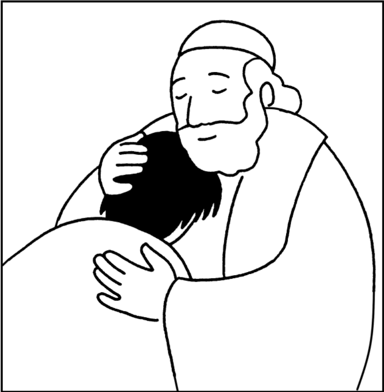
IMAGE Á COLORIER

Pierre demande à Jésus : « Combien de fois faut-il pardonner à quelqu'un ? 7 fois ? Jésus répond : « Non, pas 7 fois mais 70 fois 7 fois ! »