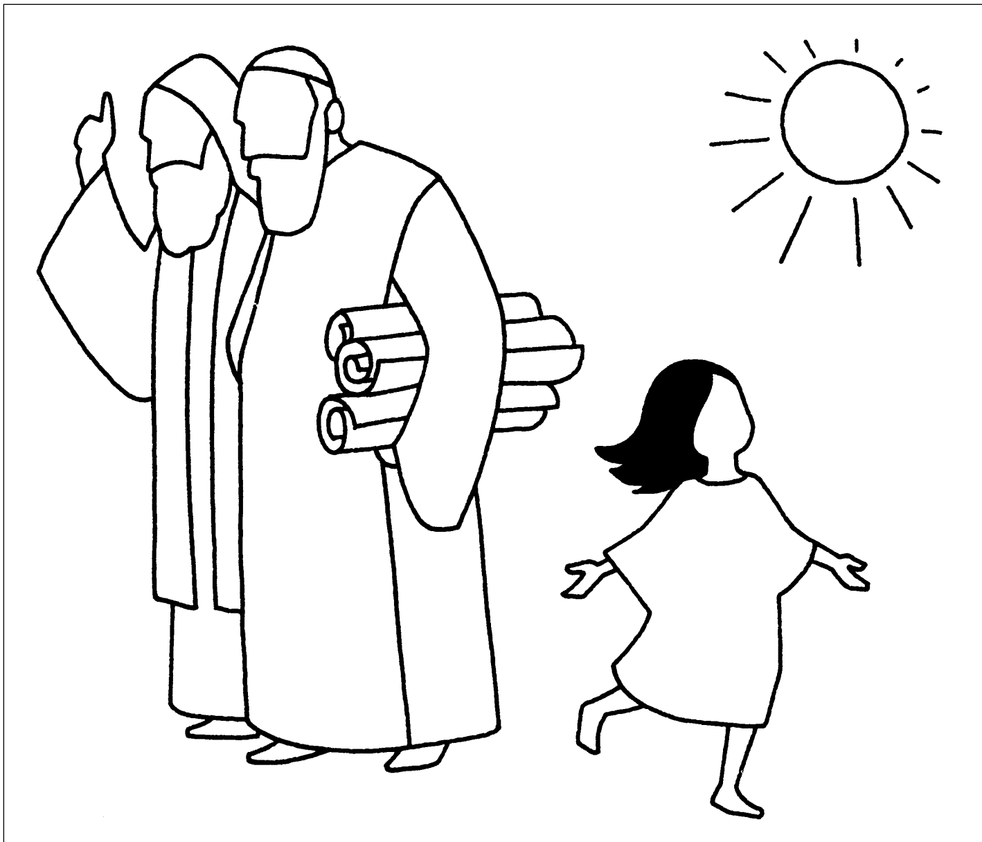
IMAGE À COLORIER

Jésus dans sa prière disait : « Père, Seigneur du Ciel et de la terre, je te remercie. Ce que tu as caché aux sages, les petits l'ont trouvé.