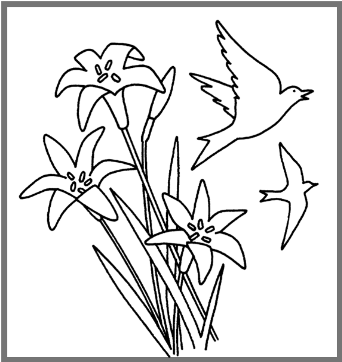
IMAGE Á COLORIER

« Regardez les oiseaux du ciel, ils ne font pas de semis ni de moissons.