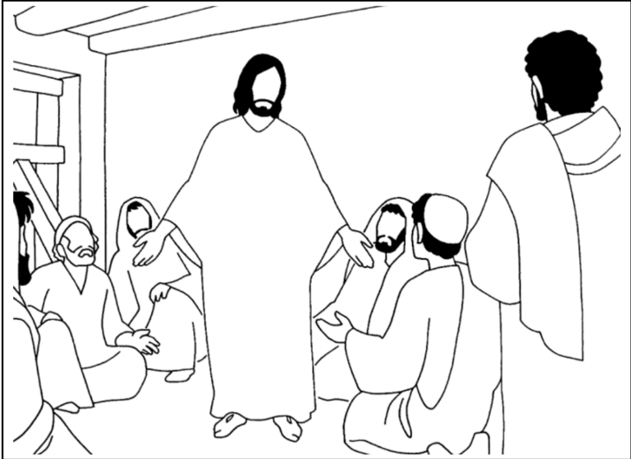
IMAGE A COLORIER

Je prie le Père pour qu'il vous envoie l'Esprit de vérité