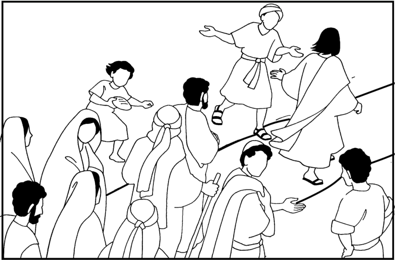
IMAGE A COLORIER

Jésus dit : je suis le chemin, la vérité et la vie