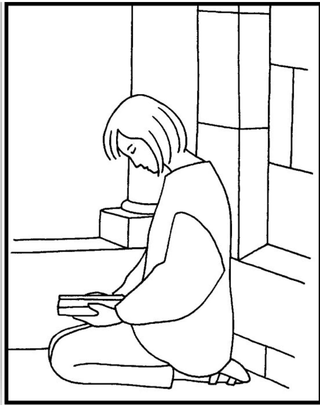
IMAGE Á COLORIER

Quand tu pries, entre dans ta chambre intérieure et ne rabâche pas. Ton Père voit dans le secret et te le rendra.