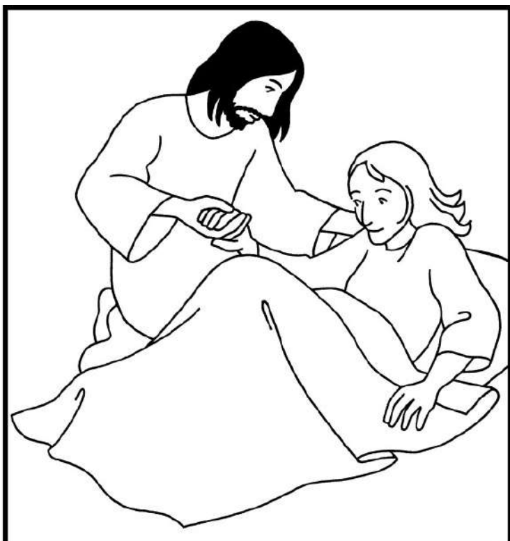
IMAGE À COLORIER

Jésus s'approche. Il prend la main de la femme. Il l'aide à se lever. Elle n'a plus de fièvre.