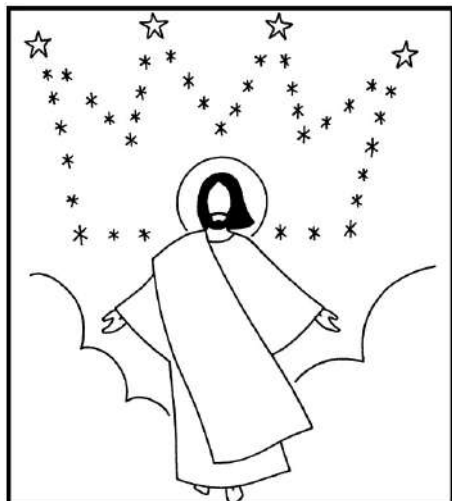
IMAGE À COLORIER

« Seigneur, tu as les paroles de la vie éternelles. Vers qui irions-nous ? Tu es le saint de Dieu ! »