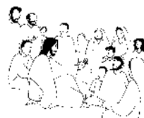
IMAGE À COLORIER