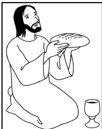
IMAGE À COLORIER

Pendant le repas, Jésus prend du pain, prononce la bénédiction et donne le pain aux disciples en leur disant : « prenez et mangez, c'est mon Corps. Prenant ensuite une coupe de vin, il rend grâce à Dieu puis il leur dit : « Prenez, buvez, Ceci est le sang de l'Alliance pour vous et la multitude ».