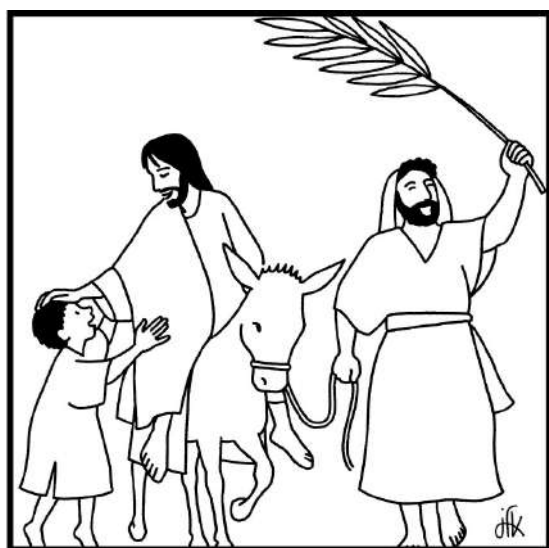
IMAGE À COLORIER

Autour de Jésus, les gens crient : « Hosanna ! Béni soit Celui qui vient au nom du Seigneur ! »