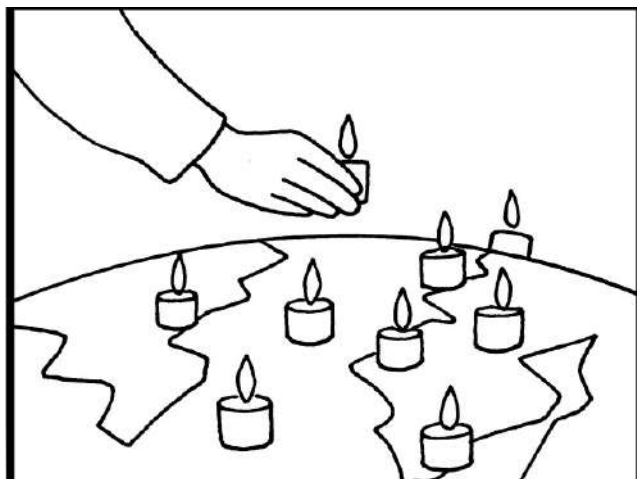
IMAGE À COLORIER

Jésus dit : « Je suis né, je suis venu dans le monde pour rendre témoignage à la vérité. Tout homme qui appartient à la vérité, écoute ma voix. »