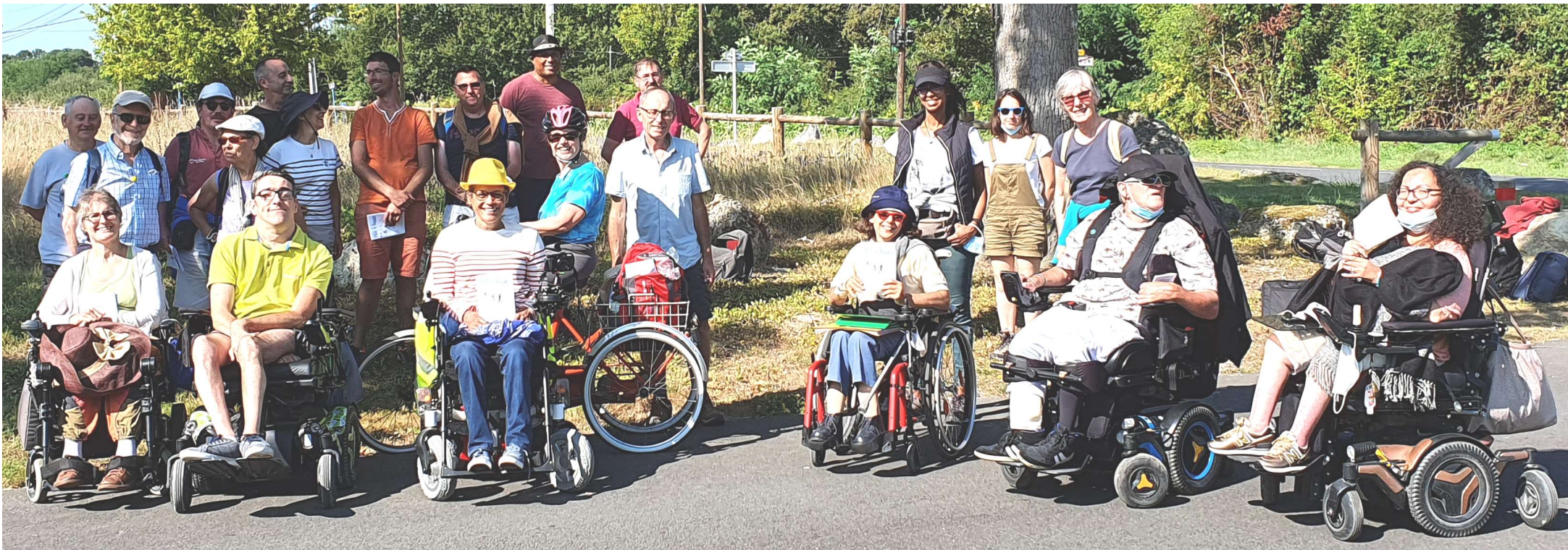
Pèlerinage à Roues. 24-26 août 2021. LANGON - BAZAS