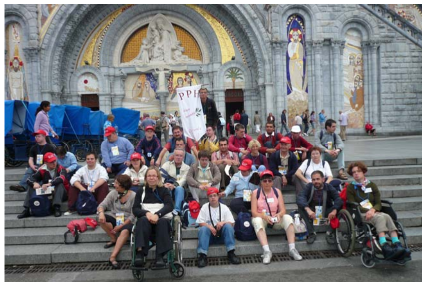
Pèlerins jeunes PPH aux JMJ à Lourdes. 15-20 Juillet