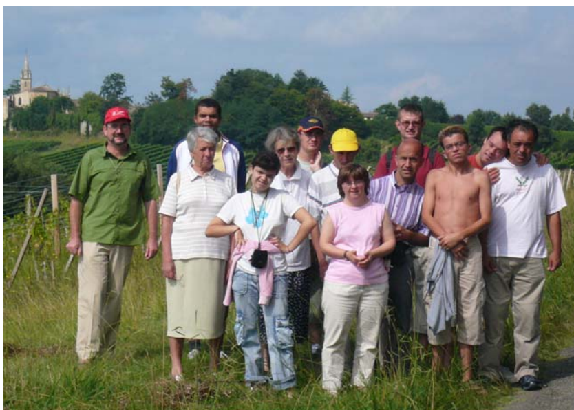
Les confirmands en retraite au BROUSSEY 30-31 août

Nous serons accueillis par la paroisse de Pessac, l'évêque sera présent.