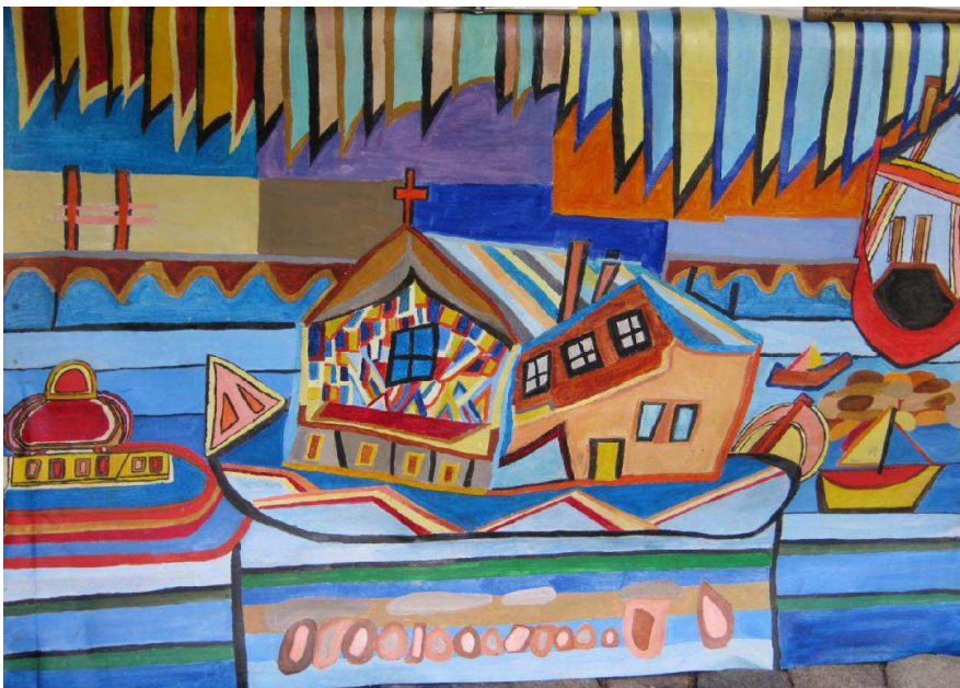
Tableau de Violaine ANFRAY. Pétales d'Argent