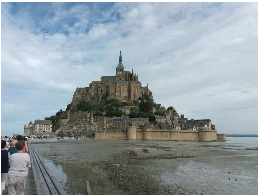
Le mont saint Michel