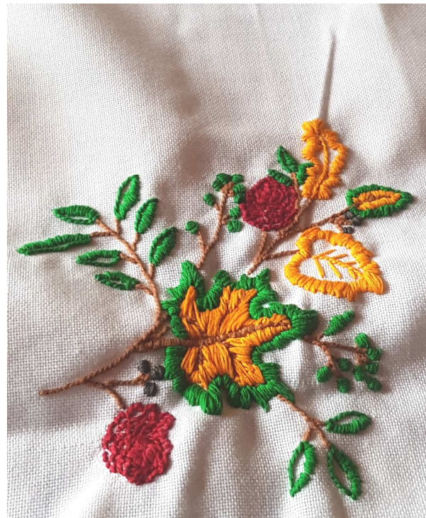
BRODERIE par Martine LOPEZ. Pétale d'Argent