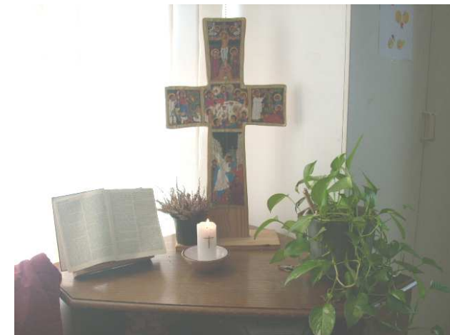
Coin prière PPH