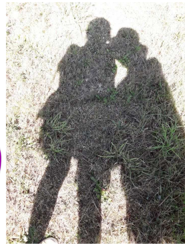
Pétales