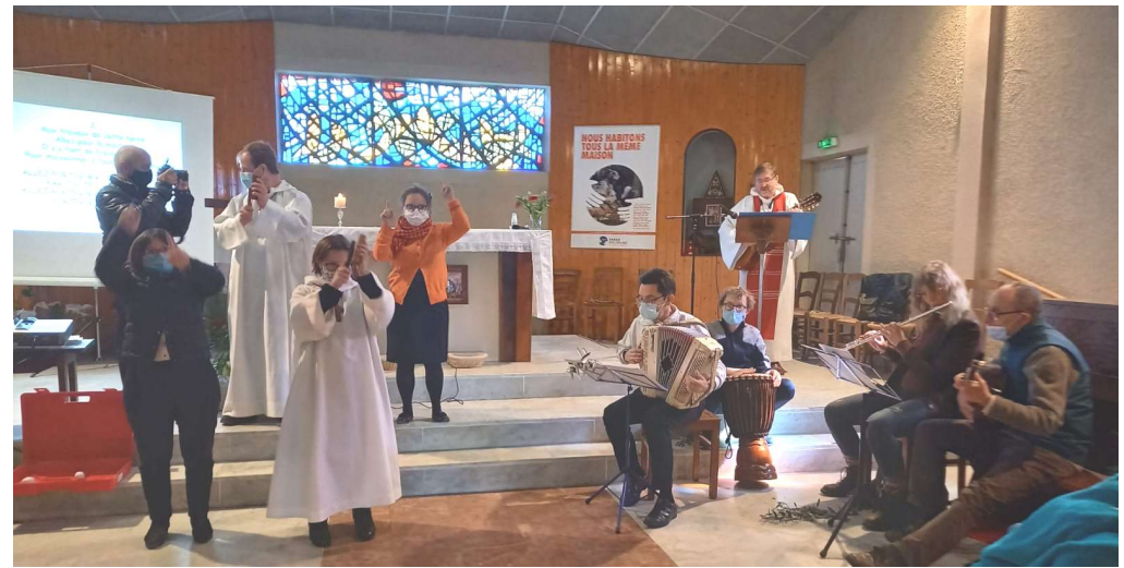
Messe des Rameaux 2021 - CENON