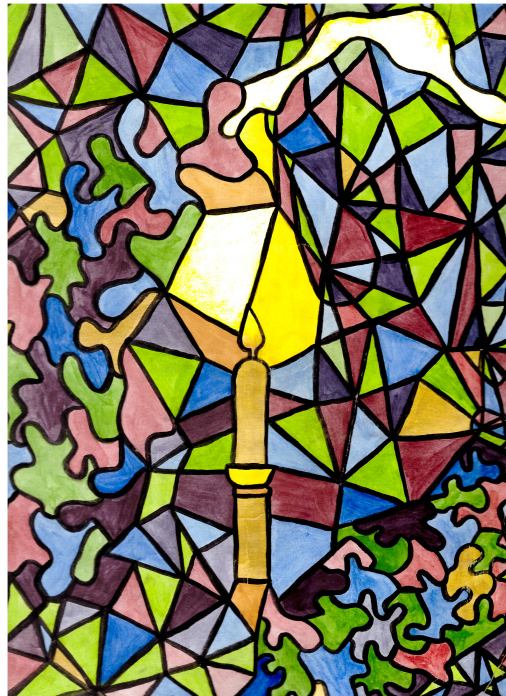
LUMIÈRE — VITRAIL Agnès MICHON