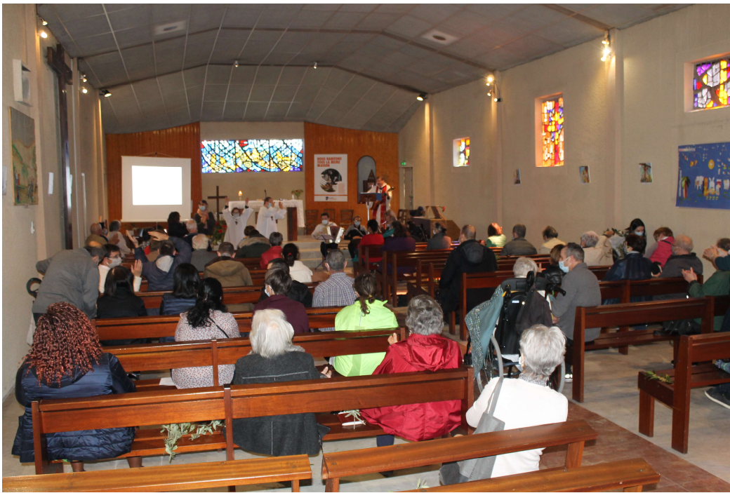
Chapelle des saints Anges gardiens CENON Messe rencontre n° 3. 28 mars fête des RAMEAUX