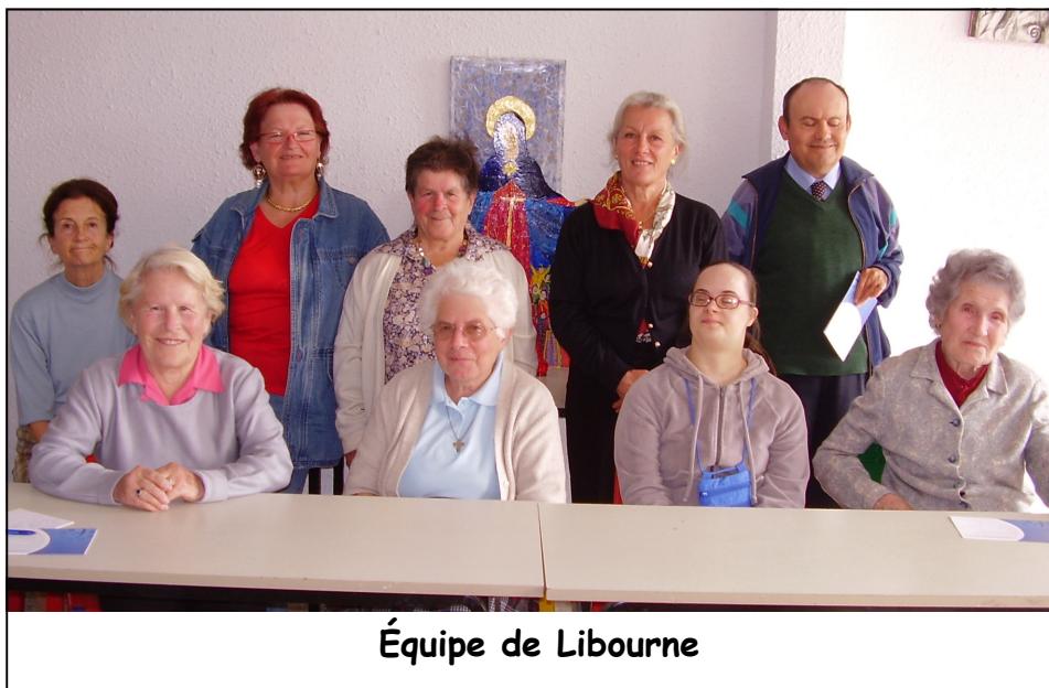
Équipe de Libourne

Pour ceux qui le souhaitent : proposition de célébrer l' Eucharistie entre 16h00 et 17h00.