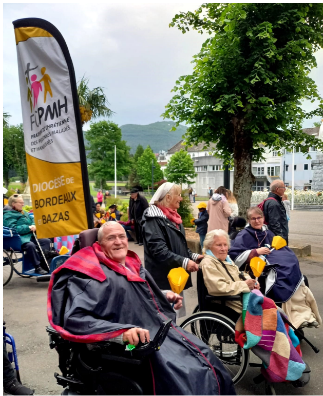
LOURDES : 20 & 21 mai 2023