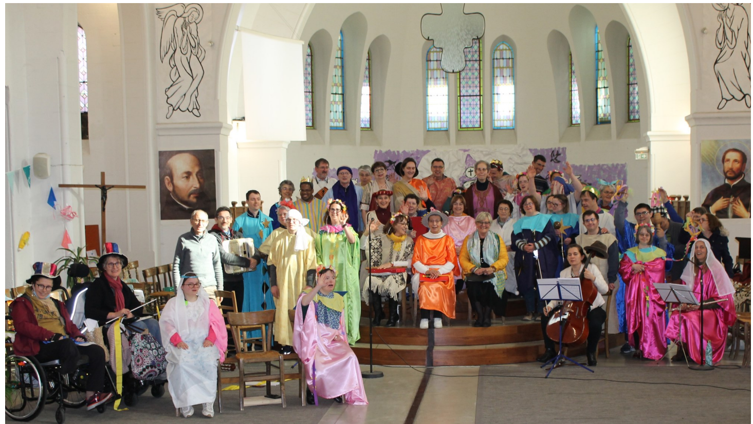
ORATORIO ND DES ANGES 19 mars 2023