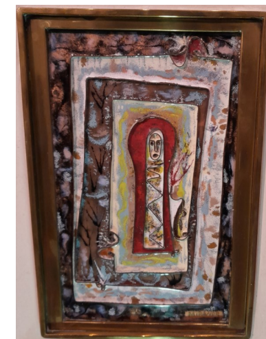
MOSAÏQUE de la résurrection de Lazare - Eglise Saint Pierre - Gradignan