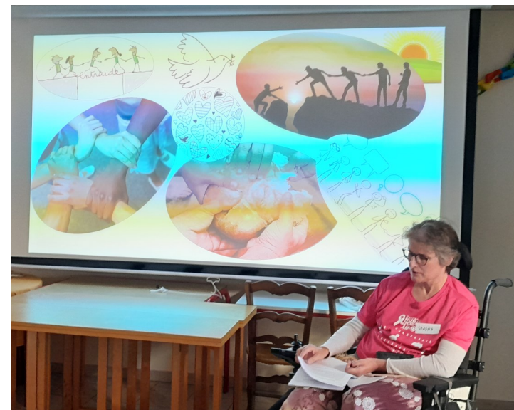
Journée de rentrée : Dimanche 23 octobre 2022.