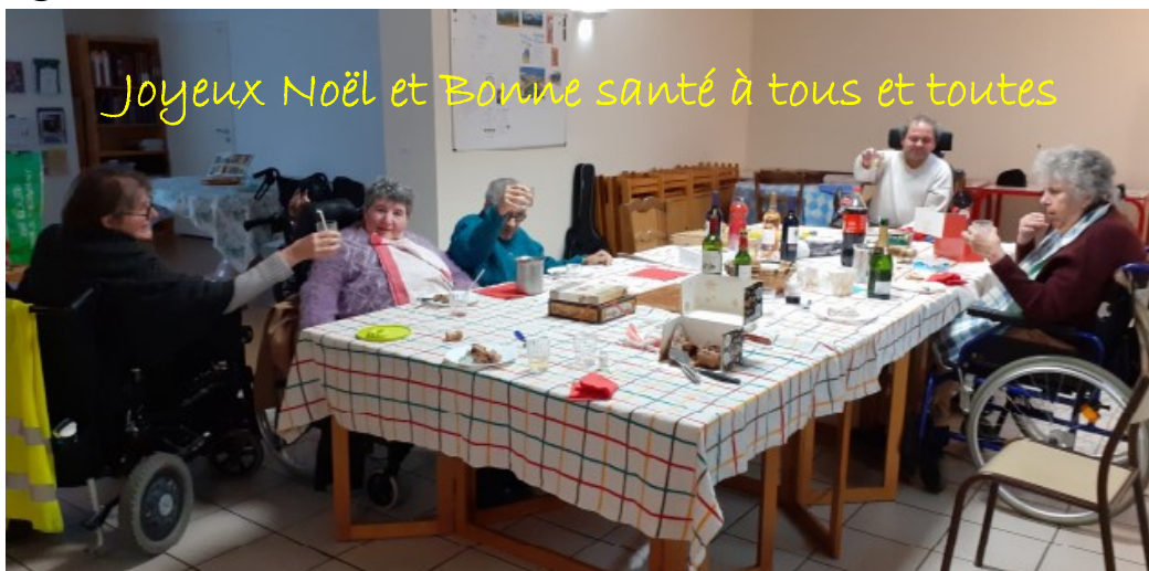
REPAS DE NOËL FRAT .25 décembre 2020

Réponse : six lis = Cilice, vêtement de crin porté sur la peau par pénitence. Ouïe !