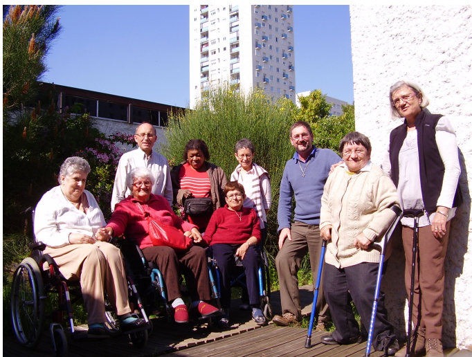
Équipe de Bordeaux Fleuve

Bordeaux Fleuve : L'équipe composée de 8 personnes, se réunit tous les 2 mois et réfléchit sur les différents sous thèmes proposés sur le Bulletin National. Lors de leur dernière rencontre, l'équipe a retravaillé avec l'Aumônier Diocésain, qui était invité sur « Responsabilités et services dans le monde et dans l'Église » (récollecion de mars).