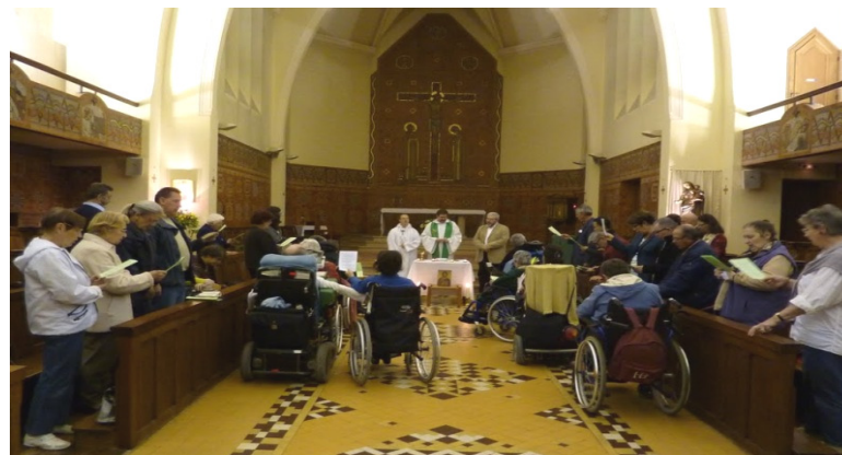
Célébration de la rentrée de la FRAT dans la chapelle du Centre Louis Beaulieu