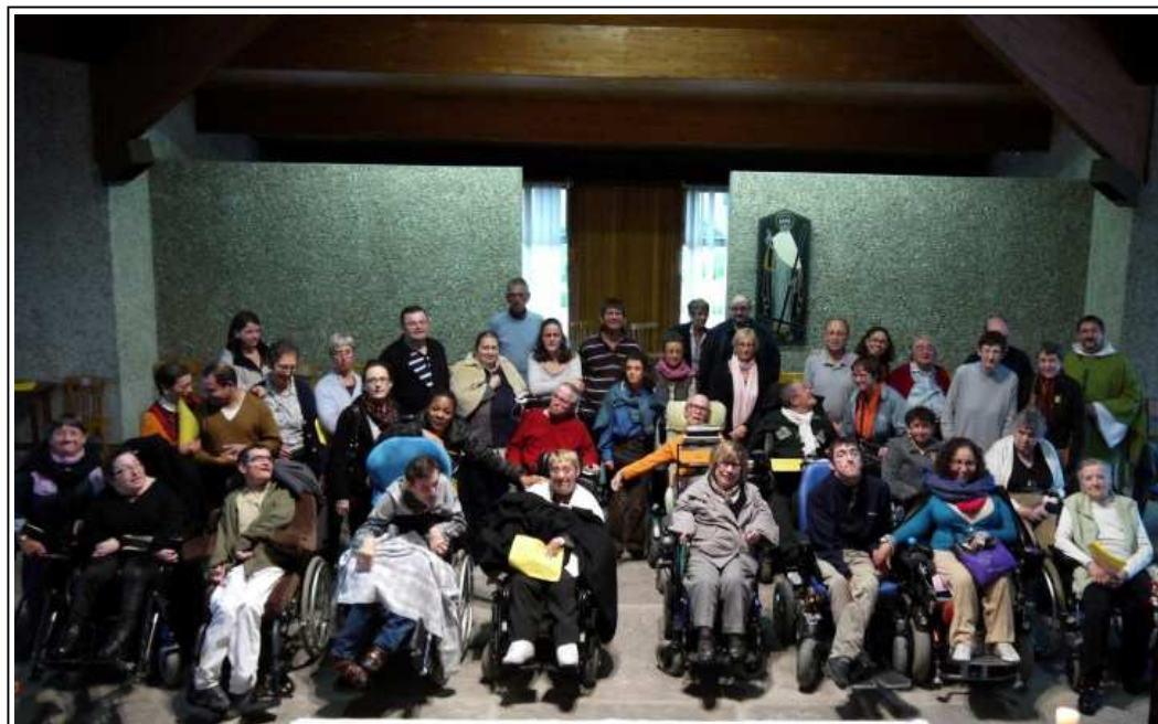
Tous unis dans la joie, nous formons une grande famille.

Le dimanche : plusieurs personnes nous ont rejoints pour travailler sur le texte d'Elie, dans le livre des Rois (19, 1-8) puis sur l'Évangile de St-Marc (2, 1-12) avec le paralytique. Ces 2 textes nous ont permis de recevoir un enseignement très enrichissant à l'aide de magnifiques et splendides tableaux. A la fin de chacune des études, se sont formés des carrefours pour récolter prières et intentions. Avec les fruits reçus par les groupes, le bureau a réuni l'ensemble des réflexions pour bâtir la célébration.